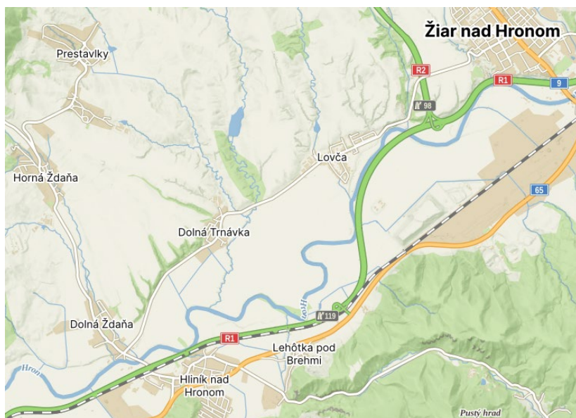
Obrázok 1 Mapa polohy obce

Obec Lovča leží uprostred Žiarskej kotliny prevažne na pravostrannej nive rieky Hron, na severovýchode susedí s okresným mestom Žiar nad Hronom, na východe s obcou Ladomerská Vieska, na juhu s obcou Dolná Ždaňa a na západe s obcami Dolná Trnávka, Horná Ždaňa a Prestavky. Nadmorská výška obce v jej strede je 243 m n. m., v chotári 231 - 335 m n. m.